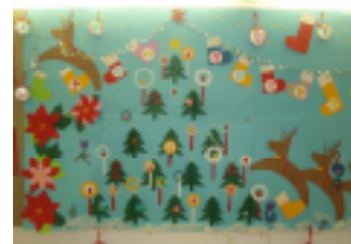
クリスマスの装飾絵とサンタさん