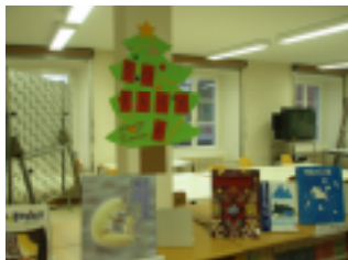
おすすめ本コーナー